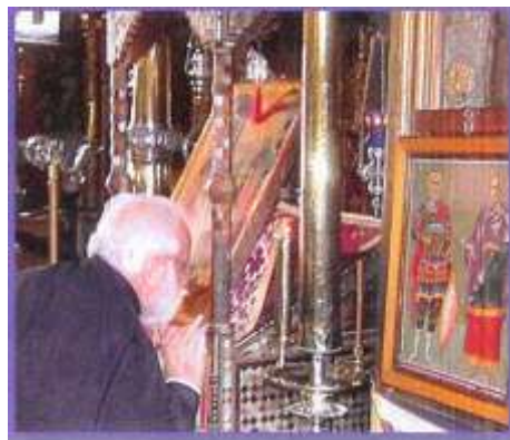
Vénération l'icône de l'Axion Estin

Puis la délégation s'est rendue au Protaton , c'est à dire la première église du Mont Athos, première à avoir été construite au Mont Athos, et qui accueille la célèbre icône de " l'Axion Estin ".