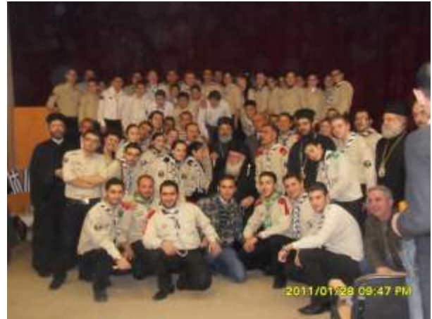
Les participants dans les salons de l'archidiocèse d'Alep (dont le métropolitain Jean Yazigi d'Europe) – L'archevêque et le métropolitain Paul avec les jeunes

Le primat de l'Eglise de Grèce a par la suite béni et coupé les vasilopita (gâteaux de Saint Basile) préparés spécialement pour l'occasion.