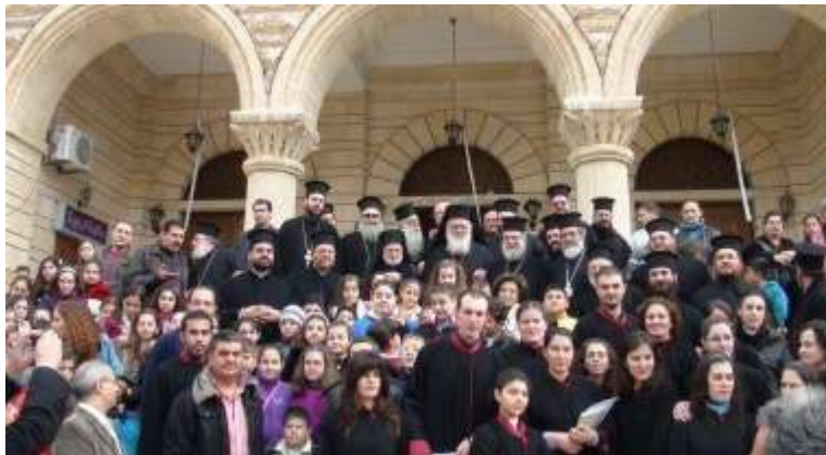
Avec les fidèles devant l'entrée de l'église Saint Georges de Hama où une prière d'action de grâce a été célébré pour accueillir l'archevêque et sa délégation