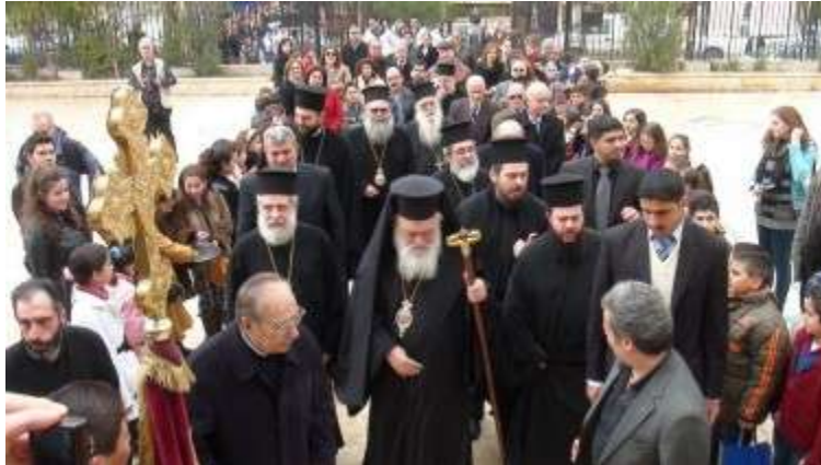
L'arrivée de la délégation à la cathédrale Saint Georges de Hama