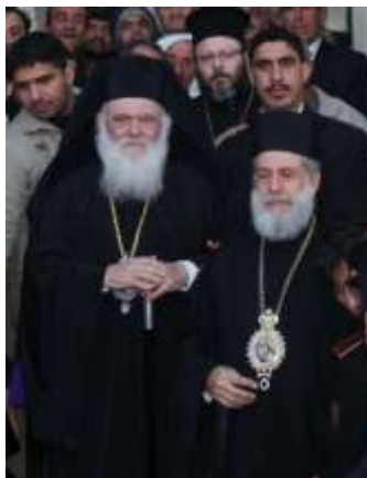
Avec le métropolitain Elie (Saliba) de Hama qui a souhaité la réouverture de l'Institut de théologie de Chalki (en Turquie) où il a étudié. L'archevêque d'Athènes a indiqué qu'il s'est senti à Athènes quand il a entendu la beauté des chants lors de l'office de l'action de grâce