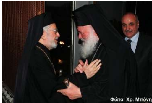
La rencontre fraternelle de deux primats : le langage des gestes et des mains !