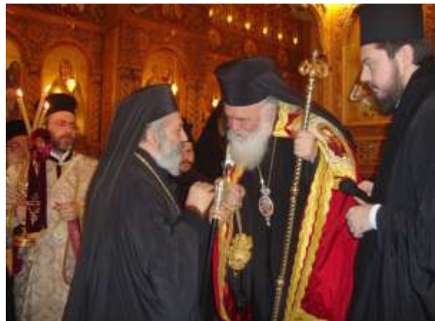
L'archevêque sur le trône et discute (photo de droite) avec le métropolite d'Alep Paul (Yazigi)

A l'issue de l'office, le primat de l'Eglise de Grèce et le métropolite Paul ont échangé présents et allocutions en présence de nombreuses personnalités et représentants des autres Eglises chrétiennes à Alep et des autorités locales.