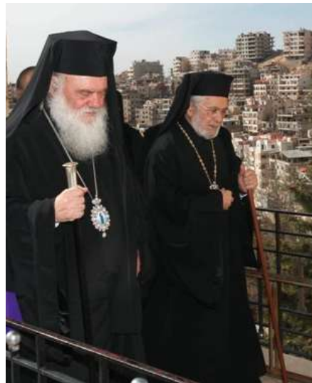
Deux pasteurs sur les vieilles terres chrétiennes de Damas qui ont connu la conversion de saint Paul au Christ et à Son Eglise !