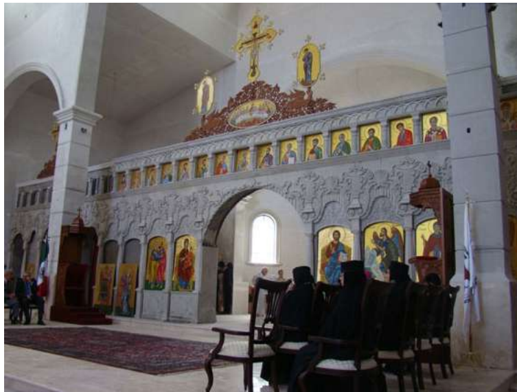
L'iconostase de l'église Saint Pierre et Paul