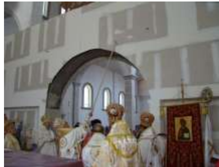
Mgr Damaskinos au premier plan et juste derrière Mgr Antoine (Chedrawi) lors de la consécration de l'autel et ci-contre, l'action de oindre les murs avec l'huile sainte