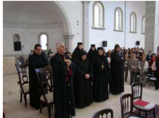
Importante participation des fidèles et de représentants des autres Eglises